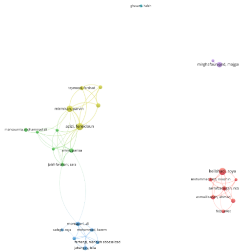
شکل ۳. نقشه همکاری علمی پژوهشگران ایران در تولیدات علمی حوزه سبک زندگی

جدول شماره ۱ نشان داده است که فریدون عزیزی و رویا کلشادی با ۲۷ سند و پروین میرمیران با ۲۲ سند برترین نویسندگان ایرانی در حوزه سبک زندگی هستند.