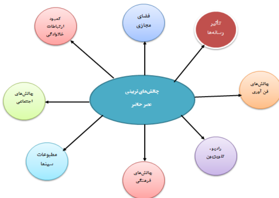
مدل ۲. نمایه چالش‌های تربیتی عصر حاضر

خانواده با تکیه بر راهبردهای قرآن کریم و نهج البلاغه ارائه شده است. با توجه به اهداف پژوهش، به بررسی راهبردهای